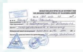
Справка с медотводом

2 Сотрудникам организации для допуска посетителей в организацию (разрешения в обслуживании) требуется организовать проверку у посетителей документов, указанных в пункте 1