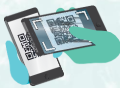
Распечатка фото QR-кода (либо его предоставление в электронном виде)