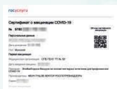
Распечатка сертификата вакцинации (либо его предоставление в электронном виде)

1 Посетители обязаны предъявить QR-код о вакцинации, перенесенном заболевании, ПЦР или медотвод уполномоченным за проверку сотрудникам организации для доступа на ее территорию. В случае отказа предоставления посетителями указанных документов сотрудникам организации необходимо отказать в обслуживании (либо предотвратить допуск в организацию)